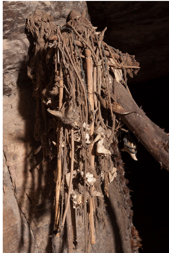
Fig. 12 : La partie haute du « fétiche mâle » est formée de tout un entrelacs poussiéreux de cordes, de bâtons, de crânes, de cornes et de mandibules de chèvres ; grotte sacrée de Tanéka Koko.

de leur robustesse et de la force magique qui leur est attachée, elles ne présentent que peu d'aménagements, si ce n'est les barricades de pierres les entourant et surtout, pour certaines d'entre elles, les ensembles de silos en terre crue formant greniers, tout à fait spécifiques de l'Atakora et même plus largement de cette région d'Afrique de l'Ouest. L'histoire se souvient de villageois se réfugiant dans ces grottes pour échapper aux razzias des cavaliers Tyokossi ou Bariba de la fin du XVIII e jusqu'au tout début du XX e s., puis de Kaba et ses partisans les utilisant comme points d'appui dans leur lutte contre les troupes françaises. Il est cependant probable que cette tradition trouve ses origines dans un passé plus lointain fait de migrations et d'affrontements entre groupes humains.