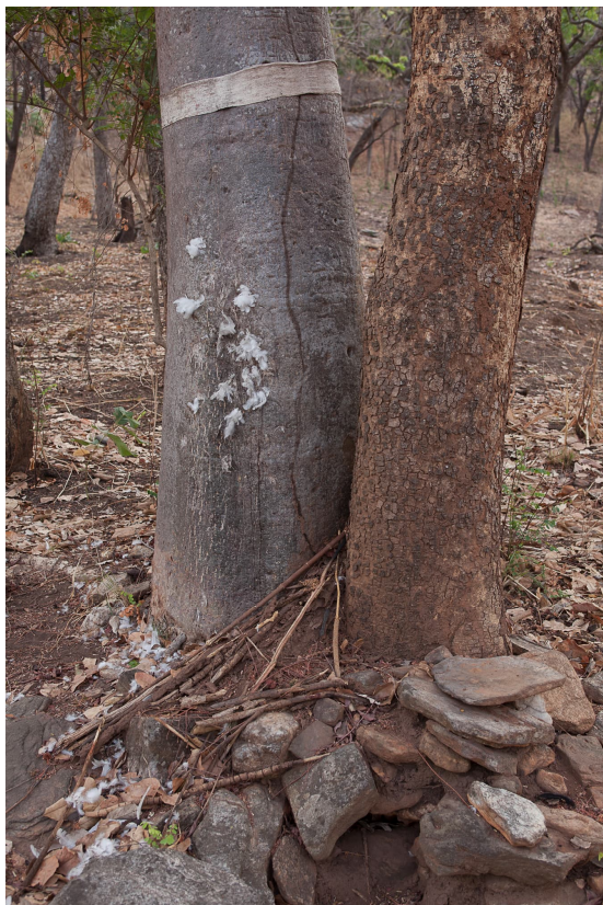
Fig. 9 : Avant d'arriver à la grotte sacrée, on passe devant le « fétiche femelle », constitué de deux arbres jumeaux dont l'un est ceint d'une étoffe et maculé de plumes collées par le sang des sacrifices ; site de Tanéka Koko.

racines tan et koko, signifiant respectivement pierre et sous, cette étymologie soulignant une relation privilégiée à la roche et au monde souterrain. C'est en effet dans une falaise, à l'écart de ce village aux cases rondes en banco coiffées de chaumes, que s'ouvre la grotte, lieu de culte majeur des Tanéka et abri d'un fétiche. Des fêtes des génies y ont lieu tous les vingt ans environ, cérémonies à l'occasion desquelles tous les Tanéka ayant quitté le village à la recherche d'un avenir meilleur reviennent au pays (TAÏROU 2014). Entre deux fêtes, le sanctuaire souterrain accueille surtout les couples en mal d'enfant, l'homme et la femme tout comme le chef féticheur - c'est ainsi que l'appellent les habitants de Tanéka Koko - devant pratiquer rites et sacrifices nus dans la grotte, parfait exemple d'un culte naturiste pratiqué au cœur de la Terre, matrice originelle garante de la fertilité du monde.