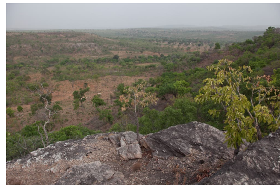
Fig. 3 : Le sommet de la barre rocheuse de Tagayé-Koutanongou offre un excellent poste d'observation dominant la savane environnante.

refuges et de points d'appui à ceux qui résistèrent au pouvoir colonial. À l'écart des takienta - ces maisons familiales fortifiées mondialement connues encore appelées tata - et des grands chemins, dominant la savane arborée qui s'étend à ses pieds en direction du sud-ouest, une longue barre rocheuse s'étire sur plusieurs centaines de mètres vers le nord-ouest. Elle se termine par un promontoire qui permettait de surveiller les villages environnants et la campagne au loin, à l'ouest comme au sud. Un ruisseau coule au pied de cet excellent poste d'observation, et des cavités naturelles se nichent à sa base. La roche, cristalline, n'a pas permis la formation de vides très importants, seulement des fissures s'élargissant par endroits en abris sous roche et des anfractuosités dans des chaos rocheux. La tradition veut cependant qu'elles aient servi d'abris et de caches du temps de Kaba (KABAKOU YORI 2014).