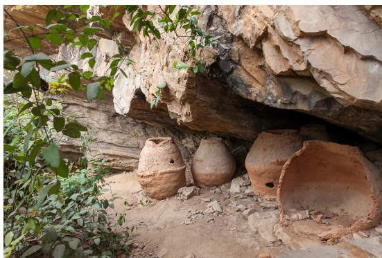
Fig. 7 : Dans l'abri sous roche constituant l'essentiel de la grotte de Oyira, les cinq silos en banco, qui auraient été construits dans les années 1920-1930, sont en bon état, excepté l'un d'entre eux aujourd'hui éventré.