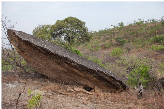
Fig 5 : Les ouvertures de la cavité qui s'étend sous ce gigantesque bloc tabulaire ont été réduites au moyen de dalles rocheuses rapportées disposées verticalement. Ces pierres plates restreignent l'accès en délimitant une sorte de goulot dans lequel il faut ramper ; site de Tagayé-Koutanongou.