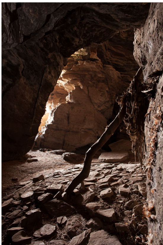
Fig. 10 : Au cœur de la grotte, éclairé par la lumière du jour qui diffuse jusque-là, le « fétiche mâle » est constitué d'un tronc sinueux d'à peu près 2 m de haut duquel pendent notamment des cordes auxquelles sont attachés des crânes et des mandibules de chèvres. Au sol, des dalles de pierre recouvrent une vaste aire centrée sur cet autel ; grotte sacrée de Tanéka Koko.

le long de la roche grise contre laquelle il est appuyé. Juste à côté, le sang et les plumes des victimes sacrifiées maculent la paroi. Au sol, des dalles de pierre soigneusement disposées recouvrent tel un grossier pavage une vaste aire centrée sur cet autel, certainement une surface sanctuarisée au cœur de la grotte. En face, sur une avancée rocheuse en surplomb elle aussi garnie de plumes, de grandes poteries hémisphériques, sans doute utilisées lors des rites qui se déroulent dans la caverne, sont soigneusement empilées, retournées les unes sur les autres. Un peu partout, les restes de torches en paille brûlées lors des cérémonies jonchent le sol.