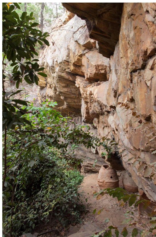
Fig. 6 : Arrivée sur la grotte de Oyira et ses silos. Ce site aurait été utilisé dans les années 1920-1930 pour soustraire des grains aux réquisitions du pouvoir colonial.

intempéries tout au plus quelques dizaines de personnes ; les quelques boyaux s'enfonçant en fond de cavité restent impénétrables ou semblent trop étroits pour conduire à une salle plus profonde, et aucun aménagement défensif n'est visible. Le site, auquel on accède depuis l'amont en suivant un petit sentier qui serpente dans la vallée puis le long de la paroi rocheuse pour descendre au pied de la chute d'eau, s'avère cependant particulièrement discret, masqué presque jusqu'au dernier moment par un écran de végétation. On l'appelle Oyira, du nom d'une divinité dont l'autel se trouve plus en aval sur la rivière.