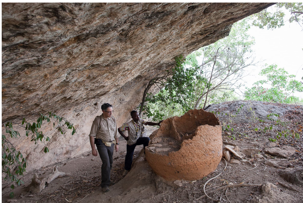
Fig. 1 : Restes d'un grand silo en banco construit dans un abri sous roche. Il est séparé en deux compartiments équivalents par une cloison centrale et devait pouvoir autrefois contenir quelquel 2,3 m 3 de grains ; site de Tagayé-Koutanongou.

In north-western Benin, the Atakora Mountains conceal rock shelters and small caves that were used by local populations until the early 20th century as places of refuge, to hide supplies and even to fight against colonial rule. This tradition, which is also found in neighbouring Togo, dates back to at least the 18th century, when the inhabitants of these regions were subjected to incessant raids by horsemen in search of slaves and grain before the colonial period. In the Atakora, as elsewhere in West Africa, caves and other cavities often have a sacred and magical character, and some cavities combine protective and religious functions. During our first trip to Benin in 2014, we were able to visit and study some of these sites steeped in history and belief.