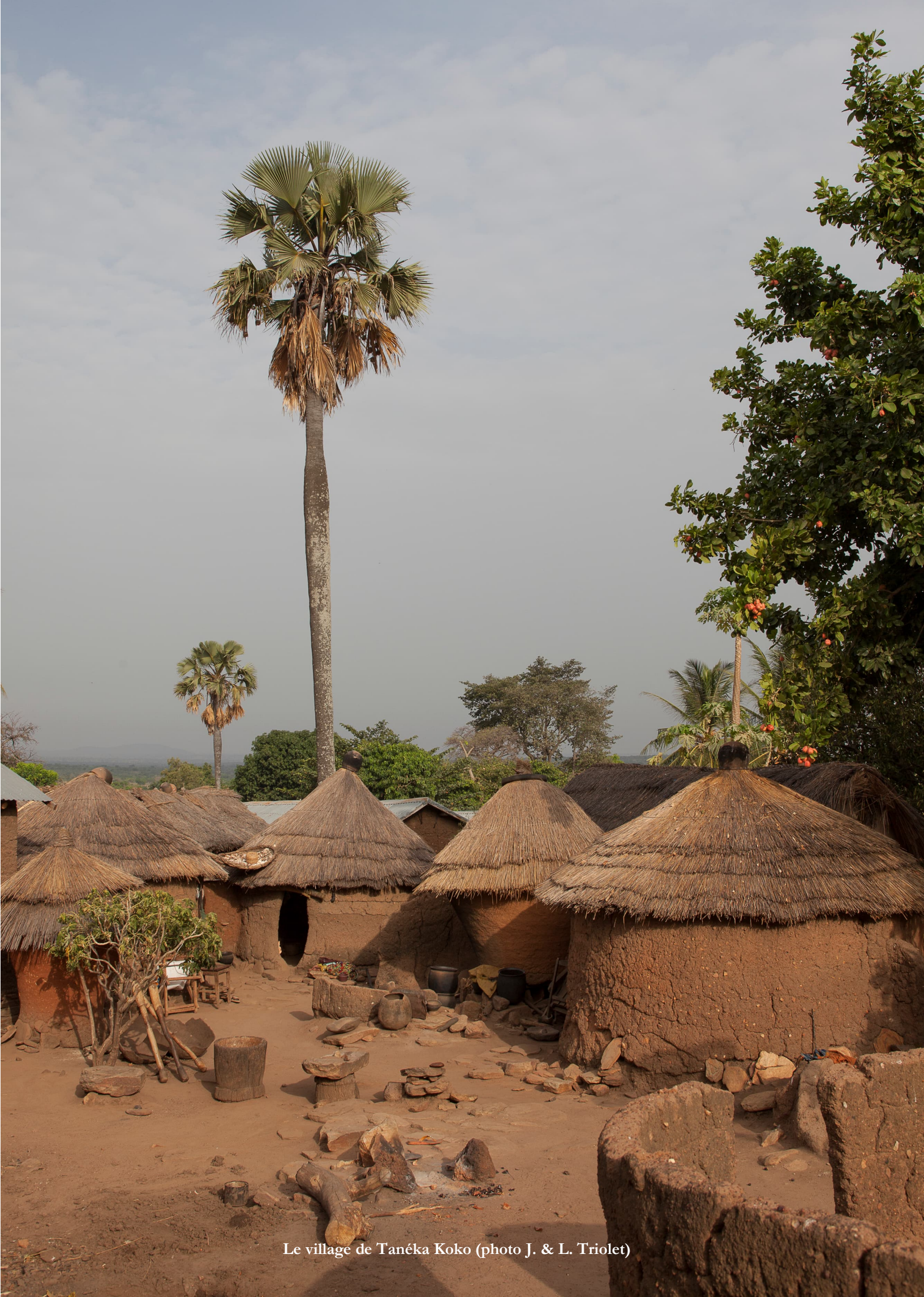
Le village de Tanéka Koko