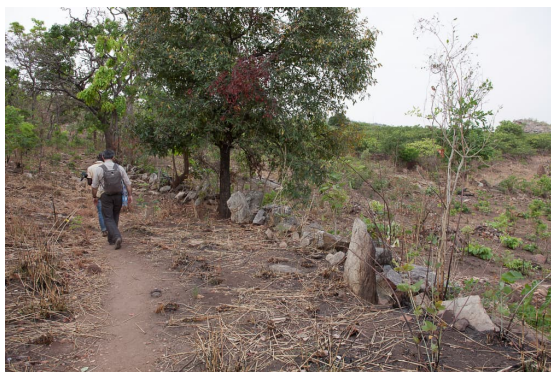
Fig. 8 : À l'écart du village de Tanéka Koko, le sentier menant à la grotte sacrée longe tout d'abord les vestiges des barricades de pierres qui, renforcées par des épineux, permettaient aux habitants de se protéger des cavaliers Bariba jusqu'au début du XX e s. (photo J. & L. Triolet).

Dans le cadre de cet univers magico-religieux aussi foisonnant que complexe, la grotte est,