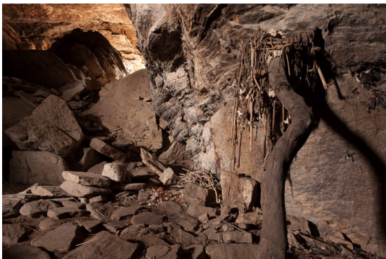
Fig. 11 : À gauche du « fétiche mâle », une grande galerie, encombrée d'énormes blocs rocheux, remonte jusqu'à une ouverture sur le plateau. À droite, les plumes et le sang des sacrifices maculent la paroi ; grotte sacrée de Tanéka Koko.

population du village. La défense de ce réduit, cœur spirituel des Tanéka, bénéficiait de surcroît de la puissance des esprits qui l'habitent toujours. Refuge à caractère magique, que les paroles incantatoires des Tanéka permettaient de fermer pour ne pas être découvert ou, au contraire, d'ouvrir afin de tirer sur les ennemis. C'est d'ailleurs un génie qui aurait autrefois révélé cette caverne pour la protection des Tanéka à une femme qui allait chercher du bois. Cette grotte, à la fois sacrée et refuge, combinait ainsi fortifications tangible et spirituelle, s'appuyant sur les pouvoirs particuliers attribués au monde souterrain et sur sa discrétion pour protéger la population du village. Cette double fonction se retrouve au Cameroun, en pays Bamiléké, où les grottes sacrées, dans lesquelles se déroulent encore aujourd'hui rites et cérémonies, servirent autrefois également de refuges lors de conflits territoriaux et de raids esclavagistes, puis durant la conquête coloniale (KENE SOMENE 2022). Il est tentant de faire là un parallèle avec les églises fortifiées de France, d'ailleurs parfois dotées d'un souterrain-refuge, qui, en d'autres temps et lieux, faisaient bénéficier ceux qui s'y réfugiaient de l'inviolabilité symbolique de l'enceinte sacrée et de la solidité de fortifications bien réelles (TRIOLET 2022).